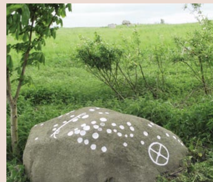
Helleristningsstenen fra Rughaven som brønddæksel. I baggrunden anes en smuk langdysse fra stenalderen.

ikke langt fra Havnsø. Vejret var godt, og i det kraftige sollys fik han øje på nogle mærker i en stor sten, der lå tæt ved en grusvej. Han så nøjere på stenen, der tjente som et slags dæksel på en brønd til en kloakledning. Det viste sig, at mærkerne var runde skålformede fordybninger, som var indhugget i stenen. Sådanne fordybninger eller skåltegn er det mest almindelige motiv på helleristningerne, og de kendes over hele landet. Men han kunne desuden se nogle svagt indhuggede linjer, der så ud til at danne en skibsform, og måske var der også et "soltegn".