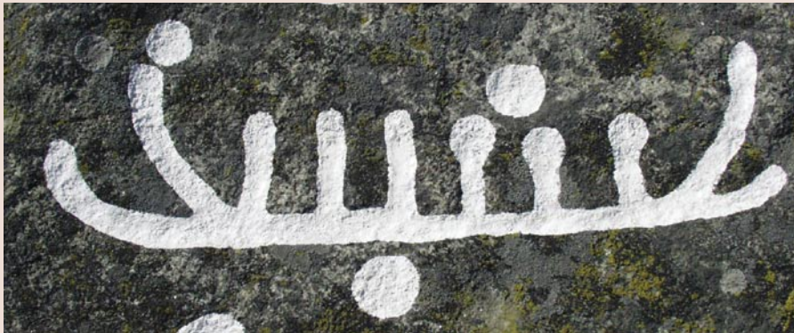
Længere nede på Breddysses dæksten findes endnu et skib, 0,47 m langt.

hæves ved en række skibsbilleder på et andet medium, på bronzegenstande. Fra yngre bronzealder kendes flere rageknive med skibsfremstillinger, bl.a. fra Røsnæs, men perlen blandt disse billeder er utvivlsomt det skib, som er gengivet på et krumsværd fra Rørby øst for Kalundborg. Det kraftige krumsværd, der i 1957 blev fundet ved kartoffeloptagning, markerer fødslen for bronzealderens religiøse kunst. Krumsværdet er fremstillet her i Norden, og ud fra bl.a. dets ornamentik kan det dateres til den tidligste bronzealder, til tiden mellem 1600 og 1500 f. Kr. Sværdet bærer vort ældst daterede skibsbillede. På dets klinger ser vi for første gang bronzealderens skib sejle afsted, her med en besætning på 35 mand, der luder fremad i sejlrættningen som for at markere, at de er i færd med at padle skibet fremad. Hvert medlem af mand-skabet udgøres af en streg, og hovedet er angivet af en lille prik. Skibet selv har højt rejste indadtrejede stævne i forlængelse af rælingens linje. I køllinjen findes foran – her til venstre – en helt ret forlængelse af kølen, mens der i agterenden findes en nærmest "pølseformet" forlængelse.