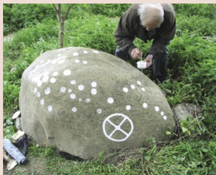
Stenen fra Rughaven opmalet ved Gerhard Milstreu.

med fingrene, males motiverne op, således at billederne i højere grad bliver synliggjort. Til denne opmaling bruges en hvid kalkopløsning, der regner bort efter kort tid. Hvis det ønskes, kan stenen derefter males op med rigtig maling. De opmalede billeder fotograferes med digitalkamera. Herefter kan de digitale fotos bearbejdes i computeren (photoshop), billedet kan renses og bearbejdes, også med hensyntagen til frottagerne, således at helleristningen til slut fremstår som overskuelig grafik. Det er vigtigt, at det ikke kun er én person, som arbejder alene. Der bør altid være to eller flere til at afgøre tingene, til at ”holde hinanden i ørerne”, så man ej ryger ud ad tangenten i ønsketænkning.