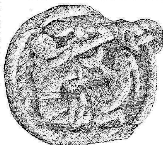
Loke og Sigyn (efter Gosforth-Korsset i Nordengland).

Sigyn holder skålen under slangen så Loke undgår giften, der drypper ned på ham.