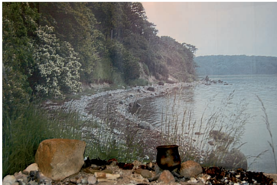
Foto fra jubilæumsårets store arkæologiske særudstilling ”Stenalderjægere ved Kalundborg Fjord”, tilrettelagt af Kalundborg Arkæologiforening.

Ved fremvisning af stamkort fra Dansk Blindesamfund eller Invalideorganisationers brugerservice kan handicappede gratis tage en ledsager med på museet. Dette er desværre ikke indrettet med elevatorfaciliteter.